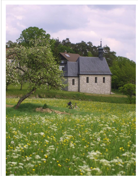
Village en Haute-Franconie

Le taux de chômage s'élève en septembre 2008 à 3,9 % contre 7,4 % pour l'ensemble de l'Allemagne.