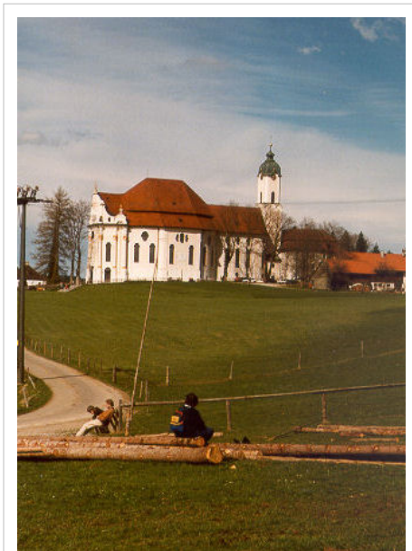
Église de pèlerinage de Wies