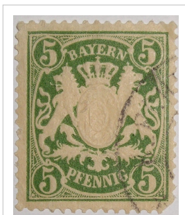
Timbre du royaume de 1867

L'État libre de Bavière fait usage, bien qu'il n'y ait pas droit à proprement parler, des grandes armes du royaume de Bavière. Autour du drapeau bleu et blanc de la Bavière, se trouvent (à partir d'en haut à gauche puis dans le sens des aiguilles d'une montre) : le lion d'or du Haut-Palatinat, les pointes argent sur fond rouge de la Franconie, les trois lions noirs de la Souabe, et la panthère bleue de la Haute et Basse-Bavière.