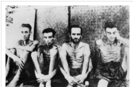
Prisonniers australiens et hollandais au camp de Tarsau en Thaïlande en 1943.

En 1992, l'historien Yoshiaki Yoshimi a publié des documents basés sur ses recherches dans les archives de l'Institut national pour les études de la défense. Il affirmait qu'il existait un lien direct entre les institutions impériales telle que