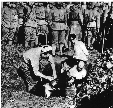
Civils chinois enterrés vivants.

Les historiens et les gouvernements de nombreux pays ont considéré officiellement les militaires de l'Empire du Japon, à savoir l'Armée impériale japonaise et la Marine impériale japonaise, comme les responsables des tueries et autres crimes commis à l'encontre de plusieurs millions de civils ou de prisonniers de guerre (PG) au cours de la première moitié du XX e siècle.