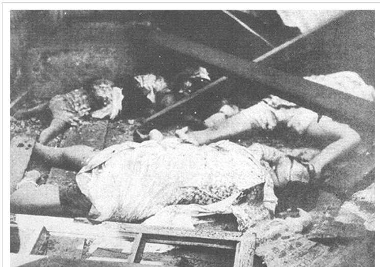
Cadavres d'une femme et de ses enfants tués par la marine impériale japonaise lors de la bataille de Manille en février 1945

Selon R. J. Rummel, professeur de sciences politiques à l'Université de Hawaii, entre 1937 et 1945, les Japonais ont «tué entre 3000000 et 10000000 de personnes, vraisemblablement 6000000 de Chinois, d'Indonésiens, de Coréens, de Philippins et d'Indochinois entre autres, y compris des prisonniers de guerre occidentaux. Ce démodicide était dû à une stratégie politique et militaire en faillite morale, à une opportunité et des habitudes militaires ainsi qu'à la culture militaire [3] .» Rummel soutient que, pour la seule Chine, les conséquences directes de l'invasion furent qu'entre 1937 et 1945 approximativement 3,9 millions de Chinois, essentiellement des civils, furent directement exterminés par les politiques du régime shōwa et 10,2 millions civils périrent des causes indirectes liés à l'invasion. [4]