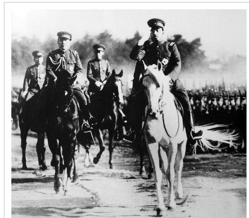
L'Empereur Shōwa chevauchant Sirayuki lors d'une inspection militaire en août 1938

La sévérité du Bushido couplée à l'ethnocentrisme du Japon dans sa phase impérialiste moderne résultait souvent en des brutalités à l'égard des civils et des PGs. Après le début d'une campagne militaire à grande échelle contre la Chine en 1937, des cas de meurtres, de torture et de viols commis par des soldats japonais semblent avoir été délibérément oubliés par leurs officiers et sont généralement restés impunis. De tels comportements se sont répétés