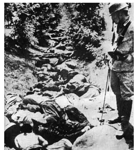
Xuzhou, Chine, 1938. Un fossé plein de corps de civils chinois tués par des soldats japonais. [1]

Bien que l'empire japonais n'ait pas signé les Conventions de Genève, qui sont depuis 1864 à la base des définitions communément admises des crimes de guerres, les crimes perpétrés tombent sous d'autres aspects du droit international et du droit japonais. Par exemple, de nombreux crimes commis par des Japonais étaient en contravention avec le code militaire japonais et ne furent pas portés devant des cours martiales comme le requiert ce code. L'empire viola également des accords internationaux signés par le Japon, en ce compris le traité de Versailles, tels que le bannissement de l'utilisation d'armes chimiques, et les Conventions de la