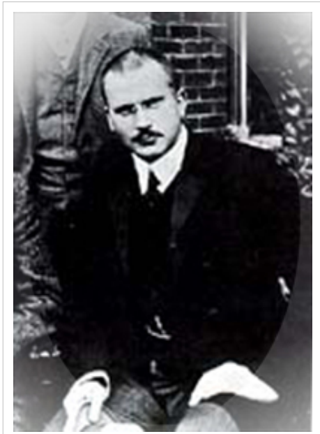
Carl Gustav Jung

Du temps de Freud, Carl Gustav Jung a critiqué le dualisme pansexualiste de la psychanalyse, il lui préférait une vision moniste avec l'idée d'une pulsion de vie unique. L'apport de Freud sur l'inconscient est mitigé, car cette notion était déjà présente en philosophie, par exemple dans l'œuvre Leibnitz au XVII e siècle et amplement débattue dans les milieux médicaux de son époque. C'est la théorisation de l'inconscient centrée sur le refoulement actif et le déterminisme psychique absolu, qui en fait l'originalité et la force. Jung reprochait à Freud de s'être cantonné à l'inconscient individuel, considérant l'individu comme sujet, dont la conscience n'est cependant pas transparente à elle-même, alors que Jung s'est attaché à décrire l'inconscient collectif. Alfred Adler a lui mis en évidence la revendication phallique qu'il estimait au centre des psychopathologies, éludant ainsi le complexe d'Oedipe. Otto Rank de son côté estimait que, plus