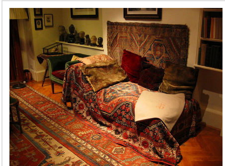
Le divan utilisé par Freud

La formation du psychanalyste, définie par Freud et telle qu'elle est recommandée par les différentes Sociétés de psychanalyse, repose généralement sur une analyse didactique (le futur psychanalyste est lui-même en analyse), à laquelle peuvent succéder une ou deux psychanalyses contrôlées : tout en conduisant une cure analytique, le psychanalyste en cours de formation est en relation avec un autre analyste afin d'apprendre à repérer le transfert et surtout à savoir repérer et analyser le contre-transfert pour mieux comprendre la dynamique de la cure.